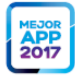
MEJOR APP EUROPEA DE BANCA FORRESTER 2017