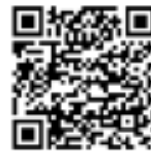
DESCARGAR APP BBVA