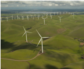
> BBVA Bonos Sostenible ISR, FI