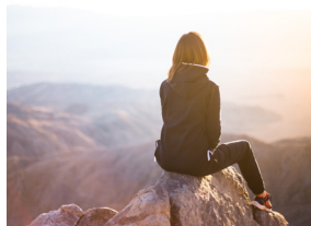
> BBVA Futuro Sostenible ISR, FI