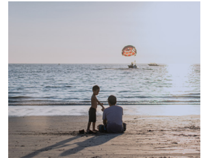
> BBVA Plan Sostenible Moderado ISR, PPI