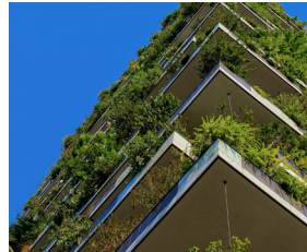
> BBVA Bolsa Desarrollo Sostenible ISR, FI